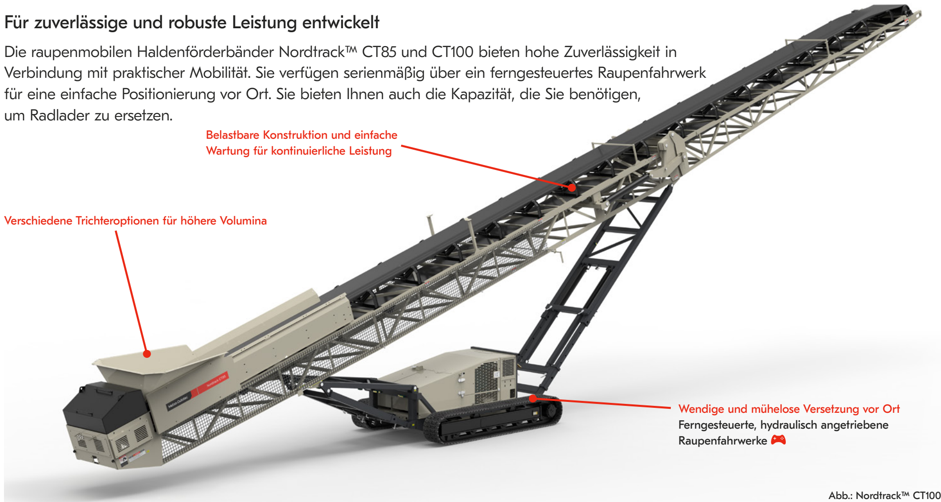
Abb.: Nordtrack™ CT100 Erhältlich nur in Nordamerika

Wendige und mühelose Versetzung vor Ort Ferngesteuerte, hydraulisch angetriebene Raupenfahrwerke 🎮