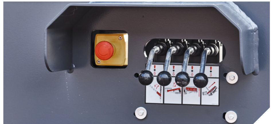
Sechs Not-Aus-Taster, Start sirene, Motorabschaltssystem und Schutzvorrichtungen für den Klemmbereich sorgen für Sicherheit