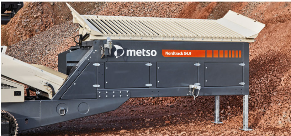
Robuster Kipprost mit ferngesteuerter Kippfunktion. Möglichkeit, auch Rüttelrost anzubieten